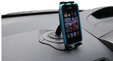
貼り付け式 GN016-SBH組合せ例